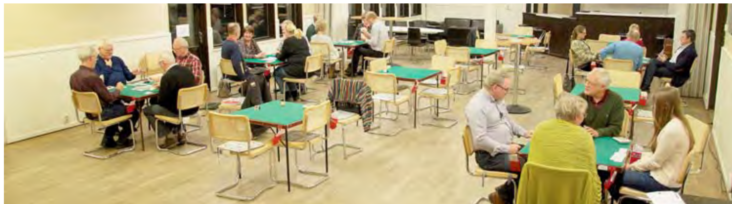
Spelträning torsdag 21 januari Nedan: Simultan tisdag 24 maj