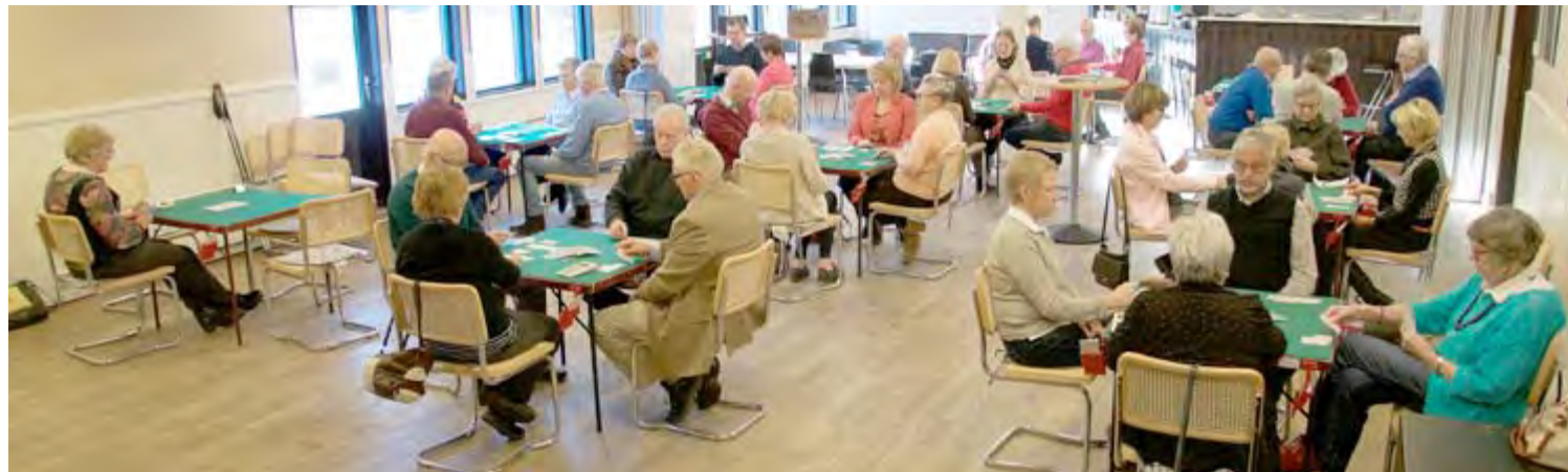
Dagbridge torsdag 21 januari