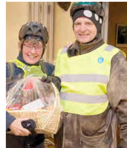
Tre korgar skänkta av ICA Dragen